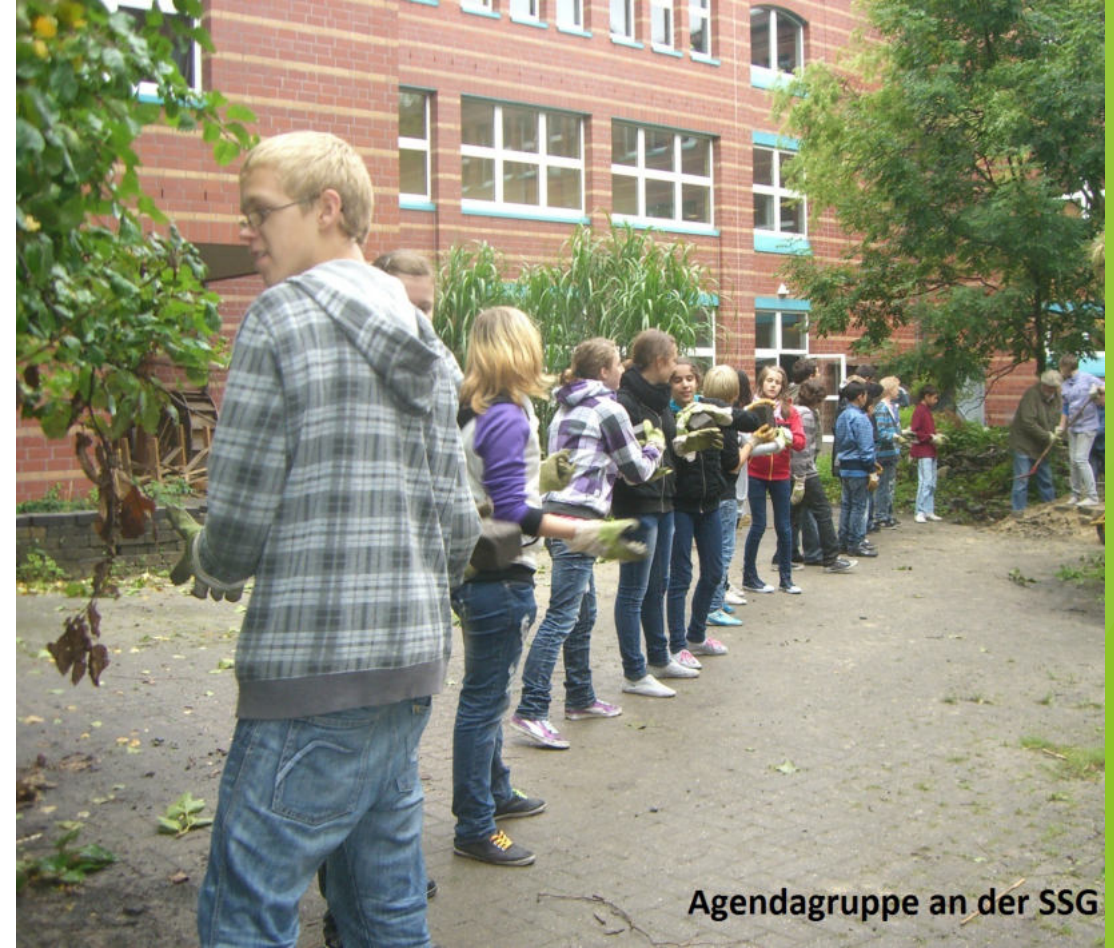
Agendagruppe an der SSG