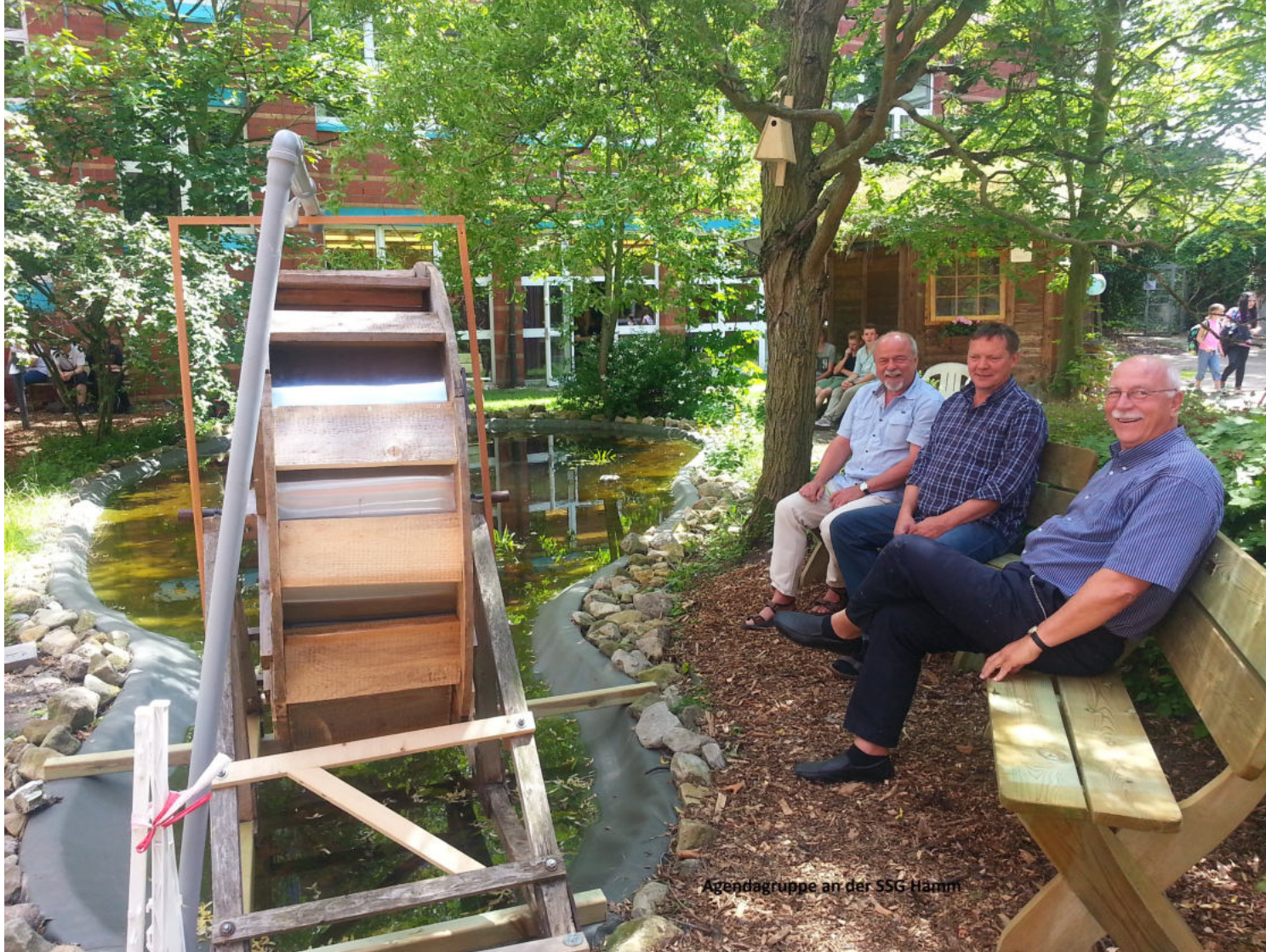
Agendagruppe an der SSG Hamm