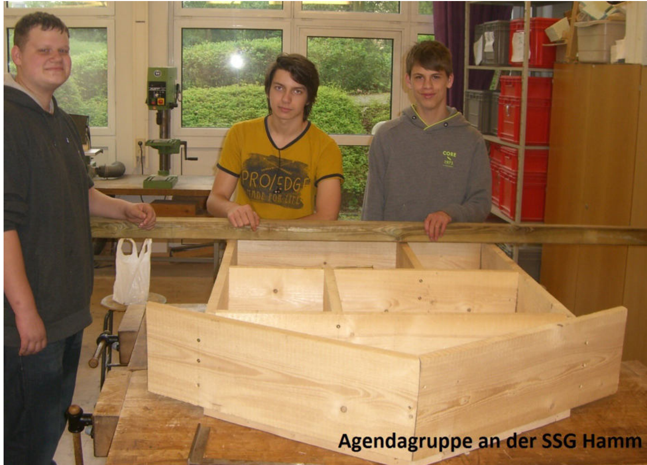
Agendagruppe an der SSG Hamm