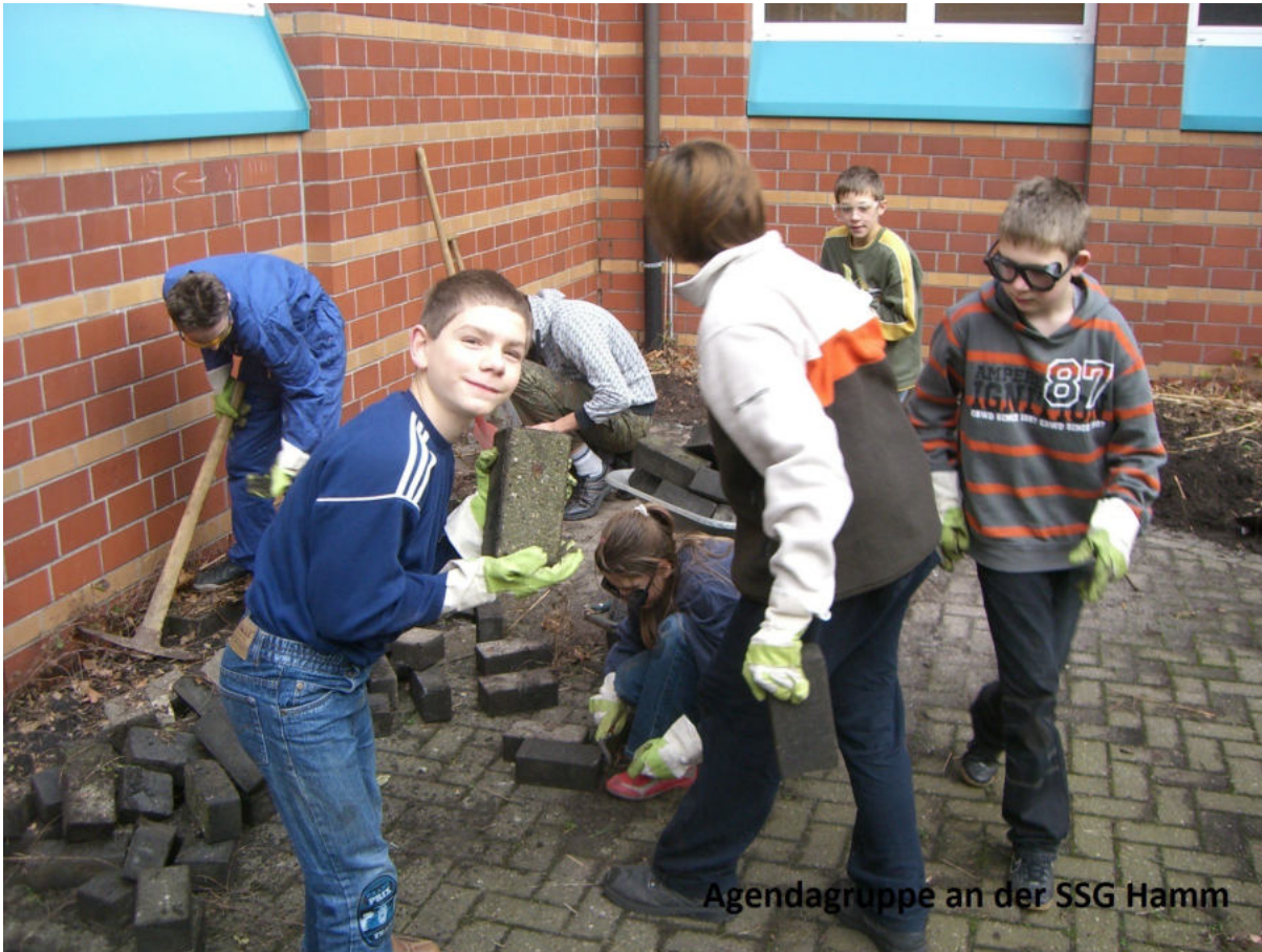
Agendagruppe an der SSG Hamm