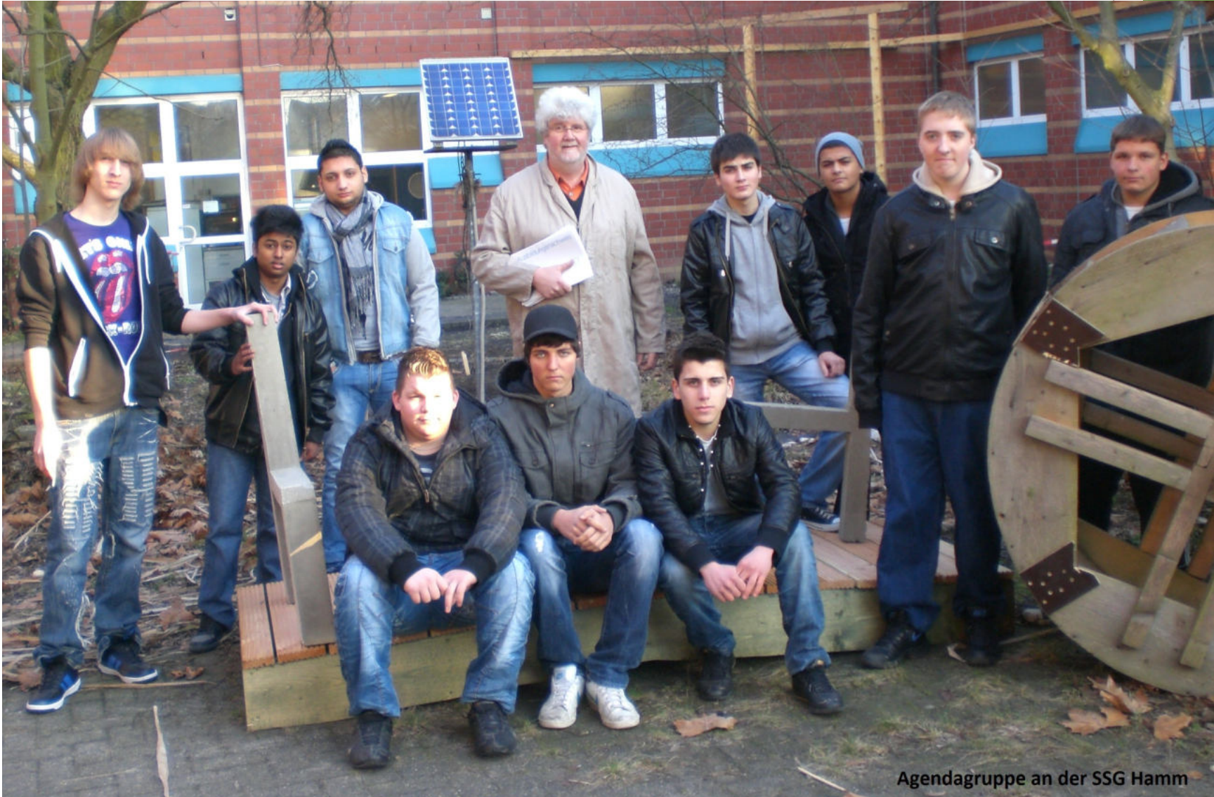
Agendagruppe an der SSG Hamm