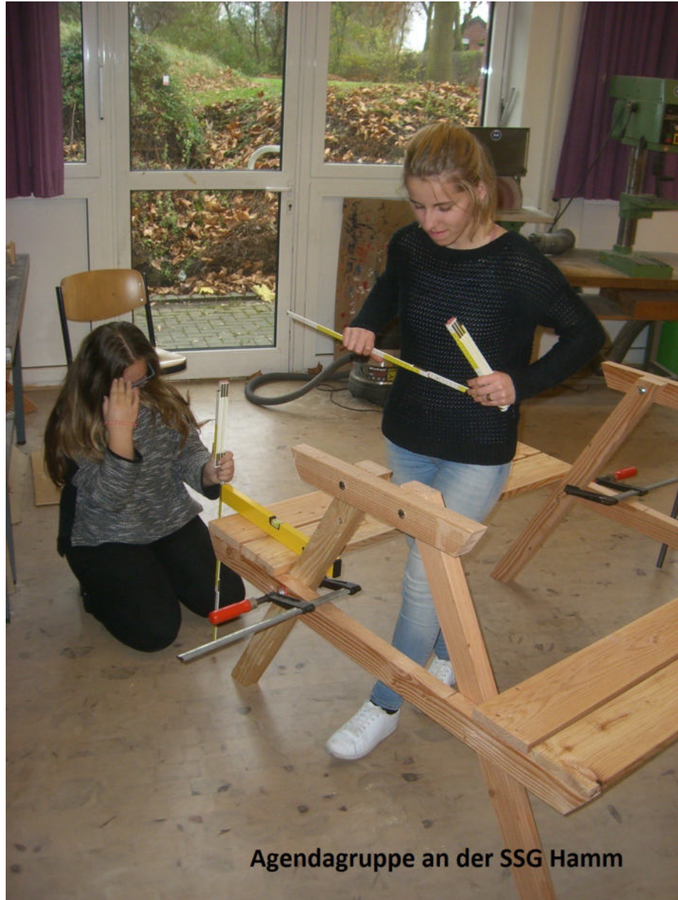
Agendagruppe an der SSG Hamm